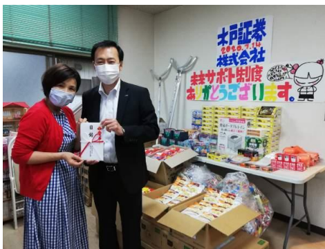
2020年7月14日 寄付金贈呈式

※同団体は、茨城県龍ヶ崎市、稲敷郡阿見町、美浦村で、無料塾と子ども食堂を開設し、5～18歳までの子ども達を支援する活動を行っています。